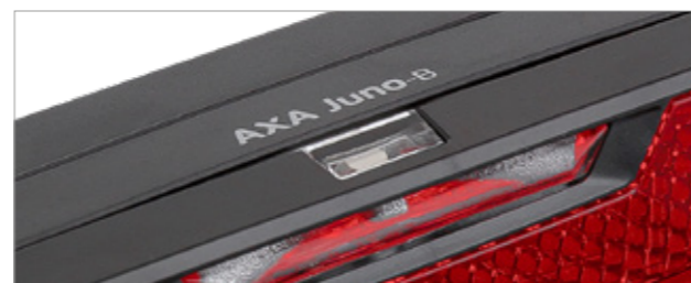
Mit Anzeige „Batterie fast leer“