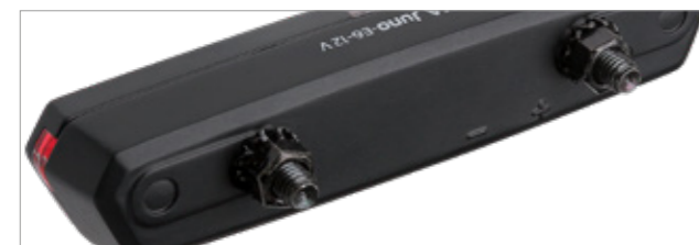
Einfache Montage bei 50 oder 80 mm

Die Dynamo-Version kann auch direkt an eine 6-V-E-Bike-Batterie angeschlossen werden. Sie verfügt über eine Standlichtfunktion, die sicherstellt, dass Ihr Rücklicht bis zu 4 Minuten lang leuchtet, wenn Sie beispielsweise an einer Ampel anhalten. Dies bietet zusätzliche Sichtbarkeit auf der Straße, auch wenn Sie nicht fahren!