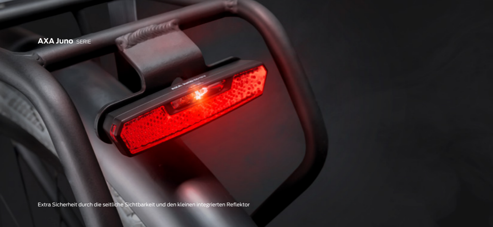
Extra Sicherheit durch die seitliche Sichtbarkeit und den kleinen integrierten Reflektor